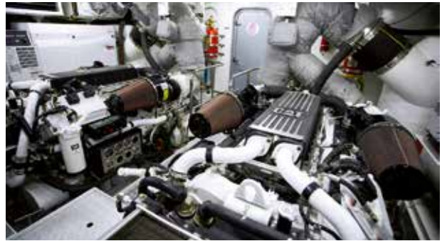
Судовой двигатель Cat® на яхте Princess.

Cat Concierge является мировым лидером и единственным поставщиком услуг такого уровня и качества. С Cat Concierge OEM-поставщики знают, что клиенты получают выдающуюся поддержку и превосходный опыт, что создаст дополнительные возможности продаж. «Cat Concierge — это программа, убежденными сторонниками которой мы были начиная с ее концепции. Она прекрасно отражает нашу собственную философию обслуживания клиентов и дополняет наши послепродажные операции на всех рынках», — говорит Крис.