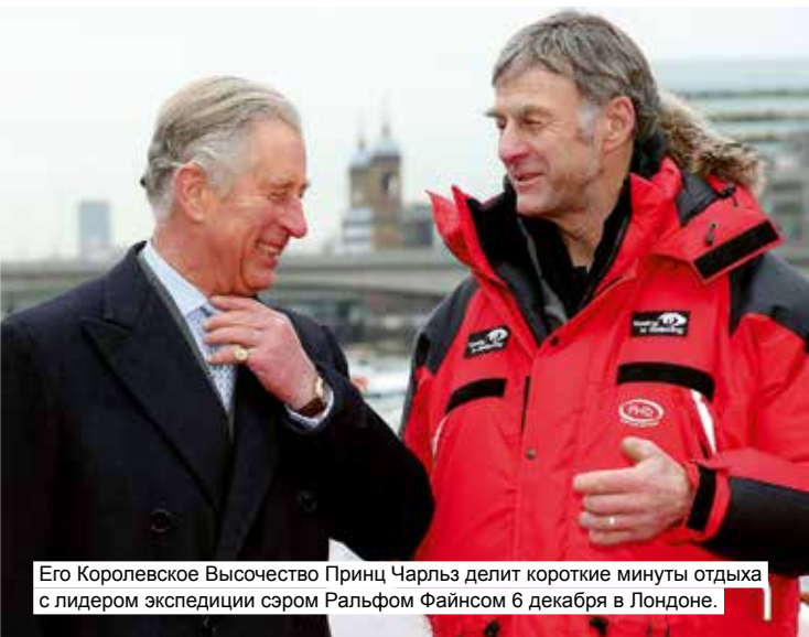
Его Королевское Высочество Принц Чарльз делит короткие минуты отдыха с лидером экспедиции сэром Ральфом Файнсом 6 декабря в Лондоне.